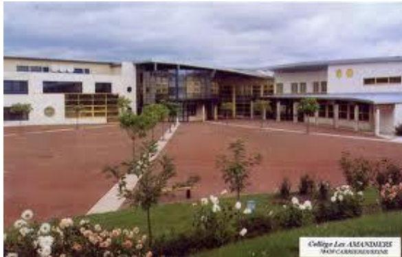
Collège les Amandiers 1 allée du Collège 78420 Carrières sur Seine