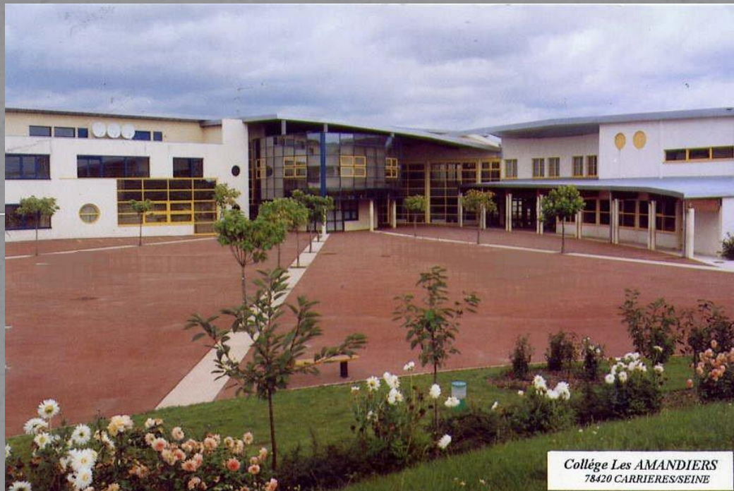
Collège Les AMANDIERS 78420 CARRIERES-SEINE