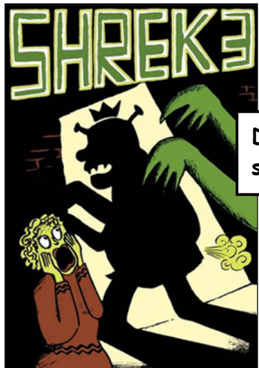
Deux affiches réalisées par Marjane Satrapi et Vincent Paronnaud dans le style de Persépolis